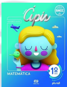
Projeto ÁPIS Matemática Editora: Ática