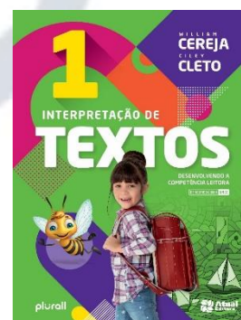
Interpretação de textos 1 Editora: Atual

FTD (Stanford): www.ftdcomvoce.com.br Cupom de acesso: FTD21RSSJS