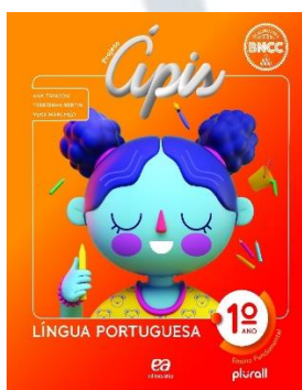
Projeto ÁPIS Português Editora: Ática

SOMOS (Ática, Atual, Saraiva e Scipione): www.domquixote-rs.com.br Cupom de acesso: Sjelotas2021