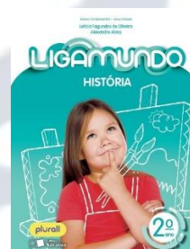
Ligamundo História Editora Saraiva