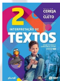
Interpretação de textos Editora: Atual