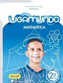
Ligamundo Matemática Editora Saraiva