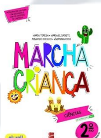
Marcha Criança Ciências Editora Scipione