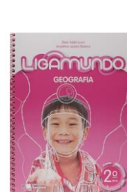
Ligamundo Geografia Editora Saraiva

FTD (Stanford): www.ftdcomvoce.com.br Cupom de acesso: FTD21RSSJS