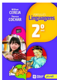
Português Linguagens Editora Atual

SOMOS (Ática, Atual, Saraiva e Scipione): www.domquixote-rs.com.br Cupom de acesso: Sjpelotas2021