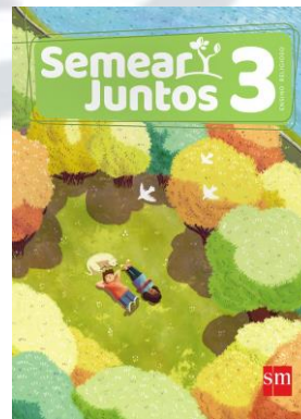
Semear Juntos Editora SM