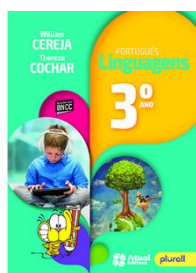
Português Linguagens Editora Atual