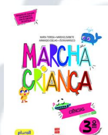
Marcha Criança Ciências Editora Scipione