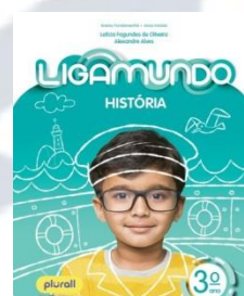
Ligamundo História Editora Saraiva