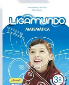
Ligamundo Matemática Editora Saraiva