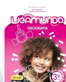
Ligamundo Geografia Editora Saraiva